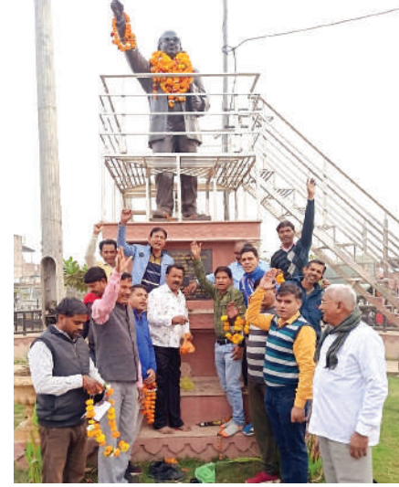
बारं में डॉ. भीमराव अंबेडकर का महानिर्वाण दिवस मनाते कार्यक्रम।